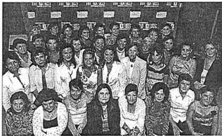
Testimonios de madres con hijos hiperactivos es el título de la obra que han escrito estas 34 mujeres, apoyadas por Anshda.

Los testimonios muestran 34 historias diferentes con puntos en común. La incompreensión de la sociedad, los problemas en el colegio, la relación de los niños con la familia, la relación entre los padres y anécdotas "graciosas" protagonizadas por los niños llevan al lector a obtener un mayor conoci-